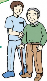
ようかいじょうたい 要介護状態