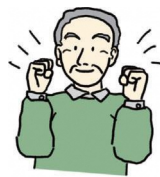
けんこうじょうたい 健康状態

フレイルとは、病 びょう 気 き や歳 とし をとることで、心や体がおとろえてくること。そのままにしておくと介護 かいご が必要 ひつよう になる可能性 かのうせい が高くなりますが、正しく取り組めば元気な体 もと に戻れます。